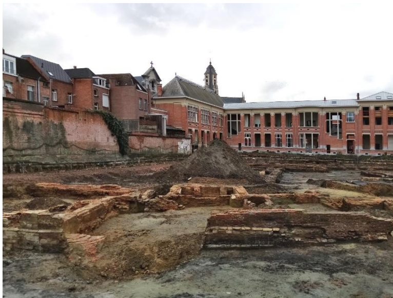
Ontdek doorheen de tijdelijke tentoonstelling hoe de site van de Normalschool is geëvolueerd.

Contacteer dan Linsy Raaffels, erfgoeddeskundige van de IOED IGEMO. Dat kan via 0473 19 26 89 of via linsy.raaffels@igemo.be .