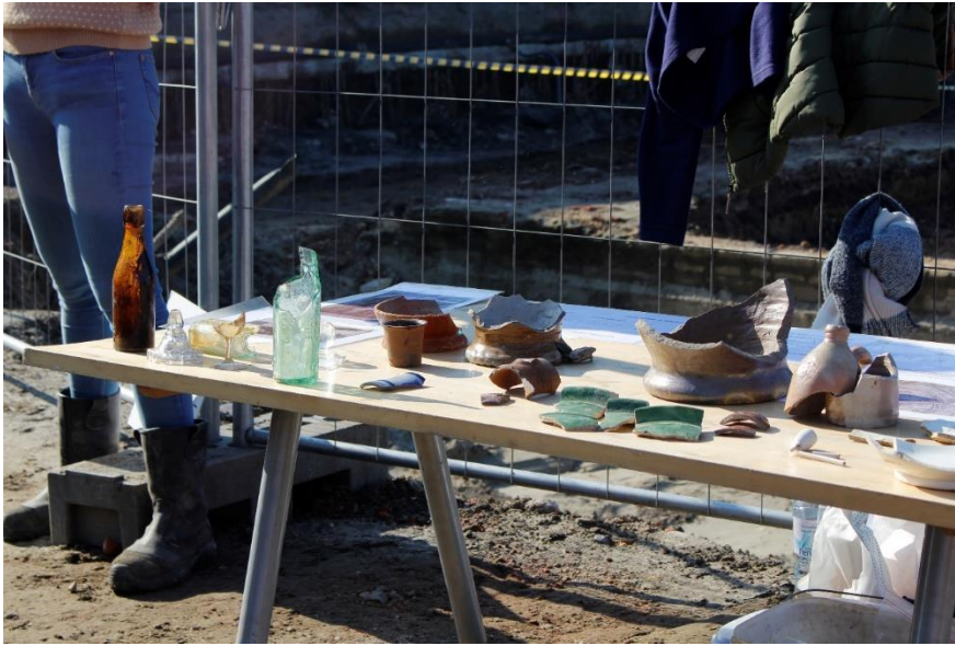
Enkele vondsten van het archeologisch onderzoek op de Normalschoolsite.