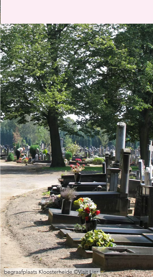
begraafplaats Kloosterheide

Breng een vrij bezoek of sluit aan bij een rondleiding in deze bijzondere zaalkerk in art deco-stijl, gebouwd in 1938-1939.